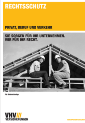
Privat-, Berufs- und Verkehrsrechtsschutz für Selbstständige